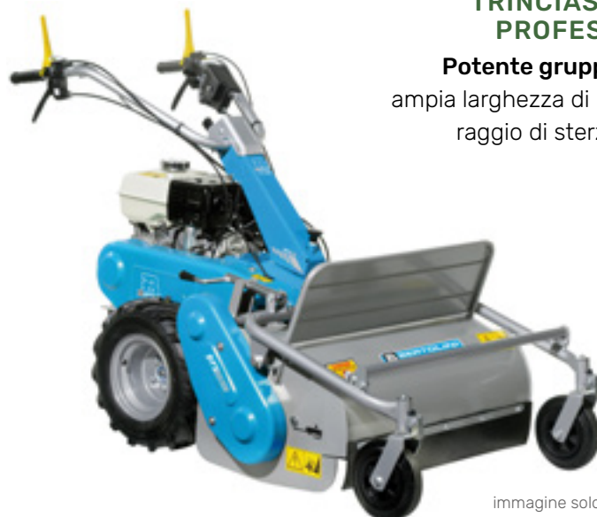
immagine solo rappresentativa

Potente gruppo di taglio, ampia larghezza di lavorazione, raggio di sterzata ridotto.