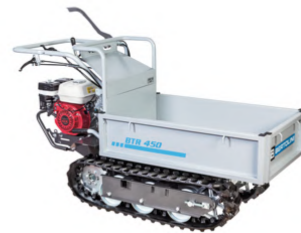
Nell'immagine BTR 450 con motore Honda GX 160.