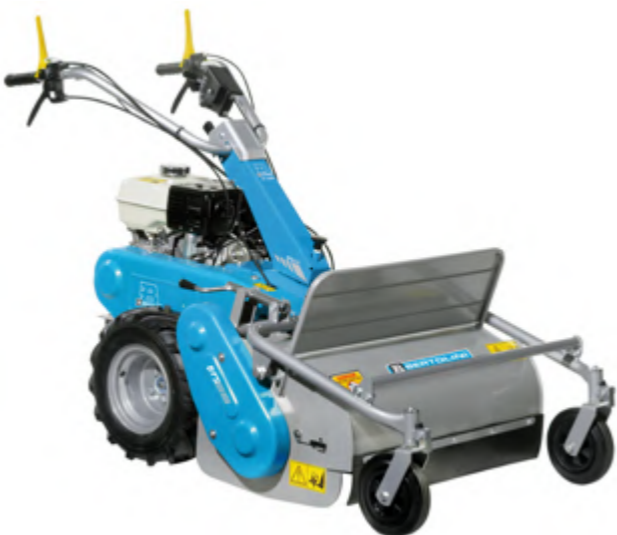
Nell'immagine BTS 65 con motore Honda GX 340.