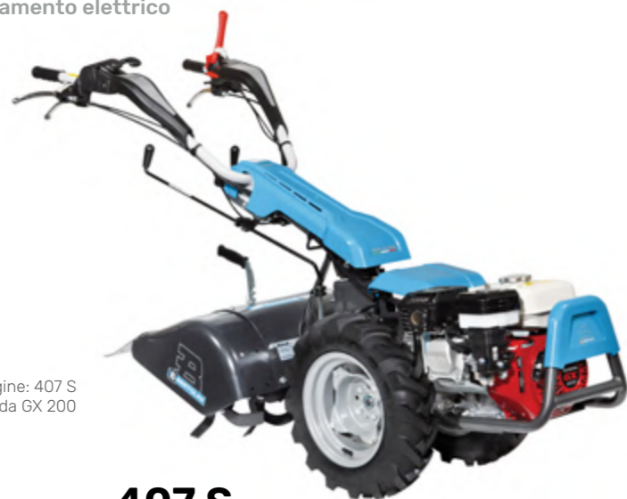
Nell'immagine: 407 S con motore Honda GX 200