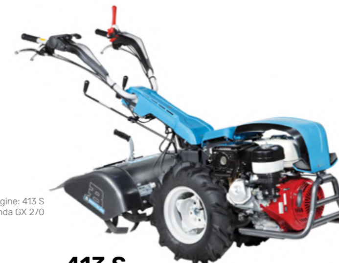
Nell'immagine: 413 S con motore Honda GX 270